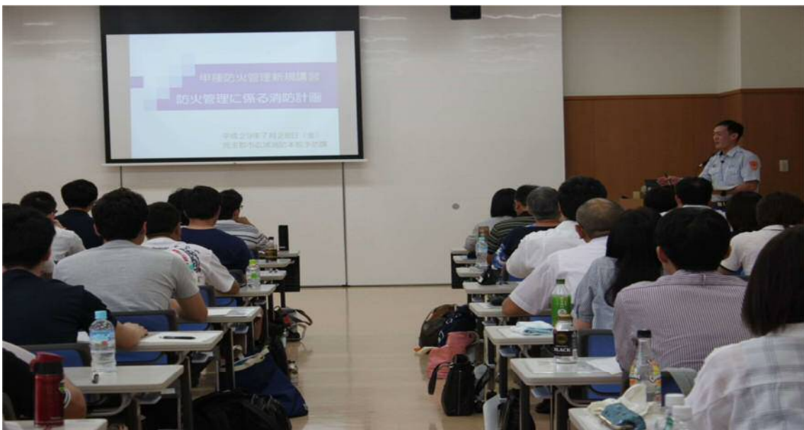
平成29年度甲種防火管理新規講習