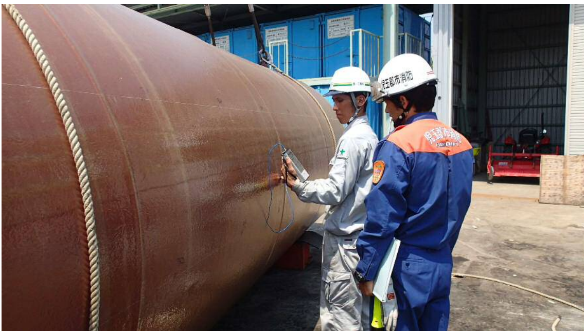
地下貯蔵タンク中間検査風景