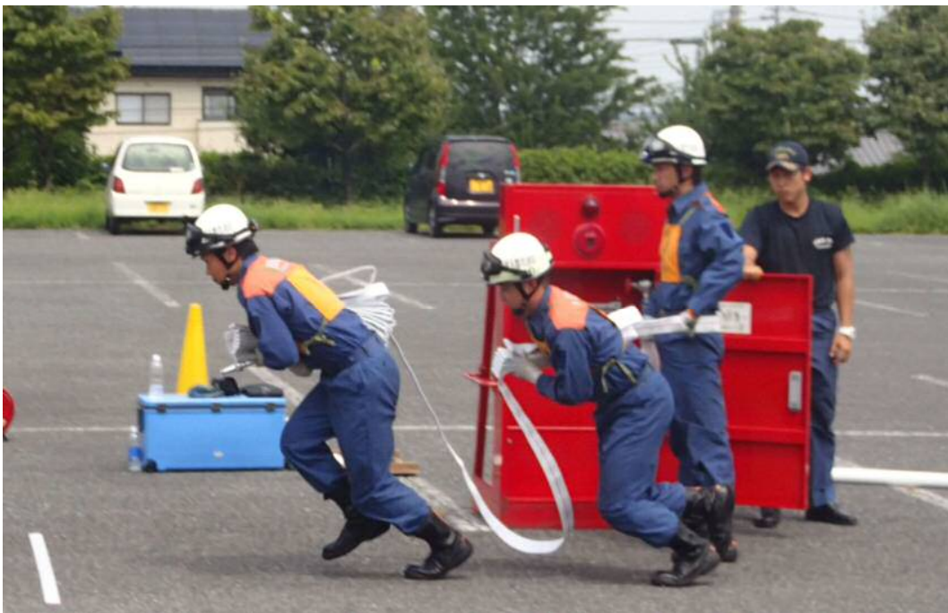
第 28 回自衛消防隊屋内消火栓操法大会指導風景