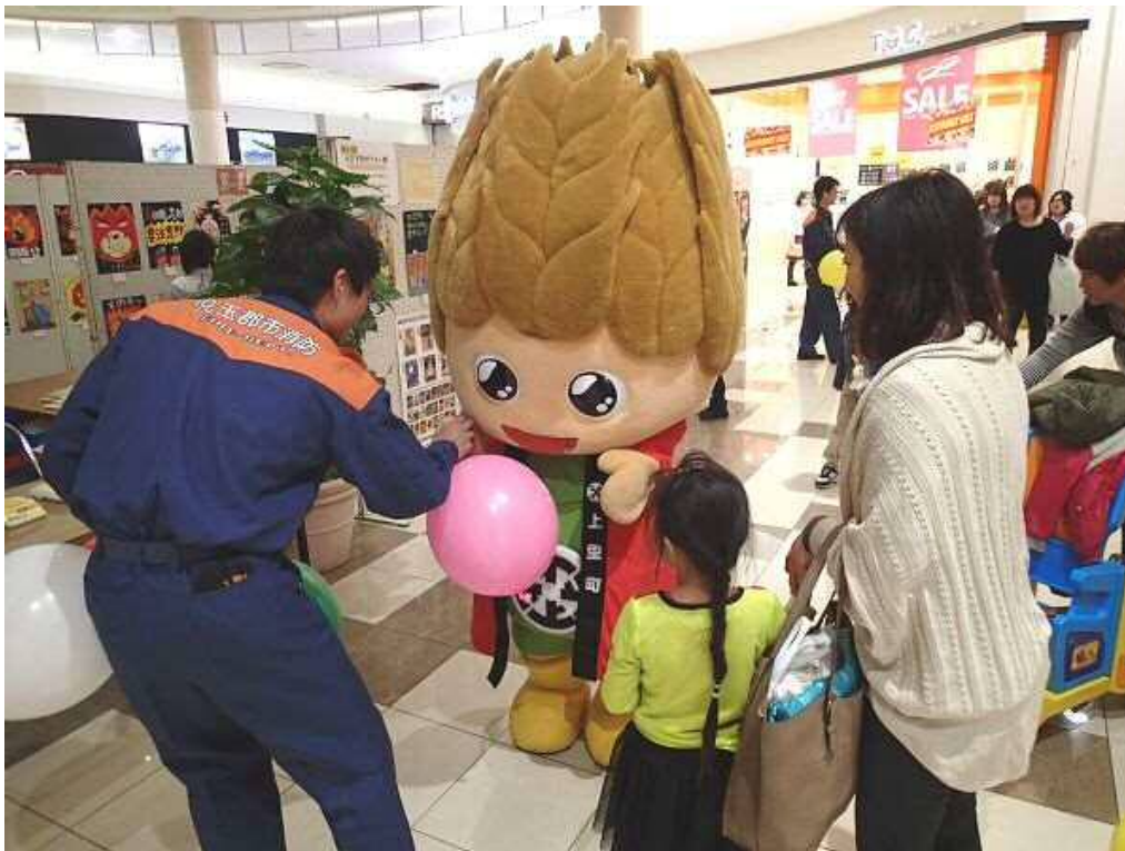
第24回火災予防ポスター展