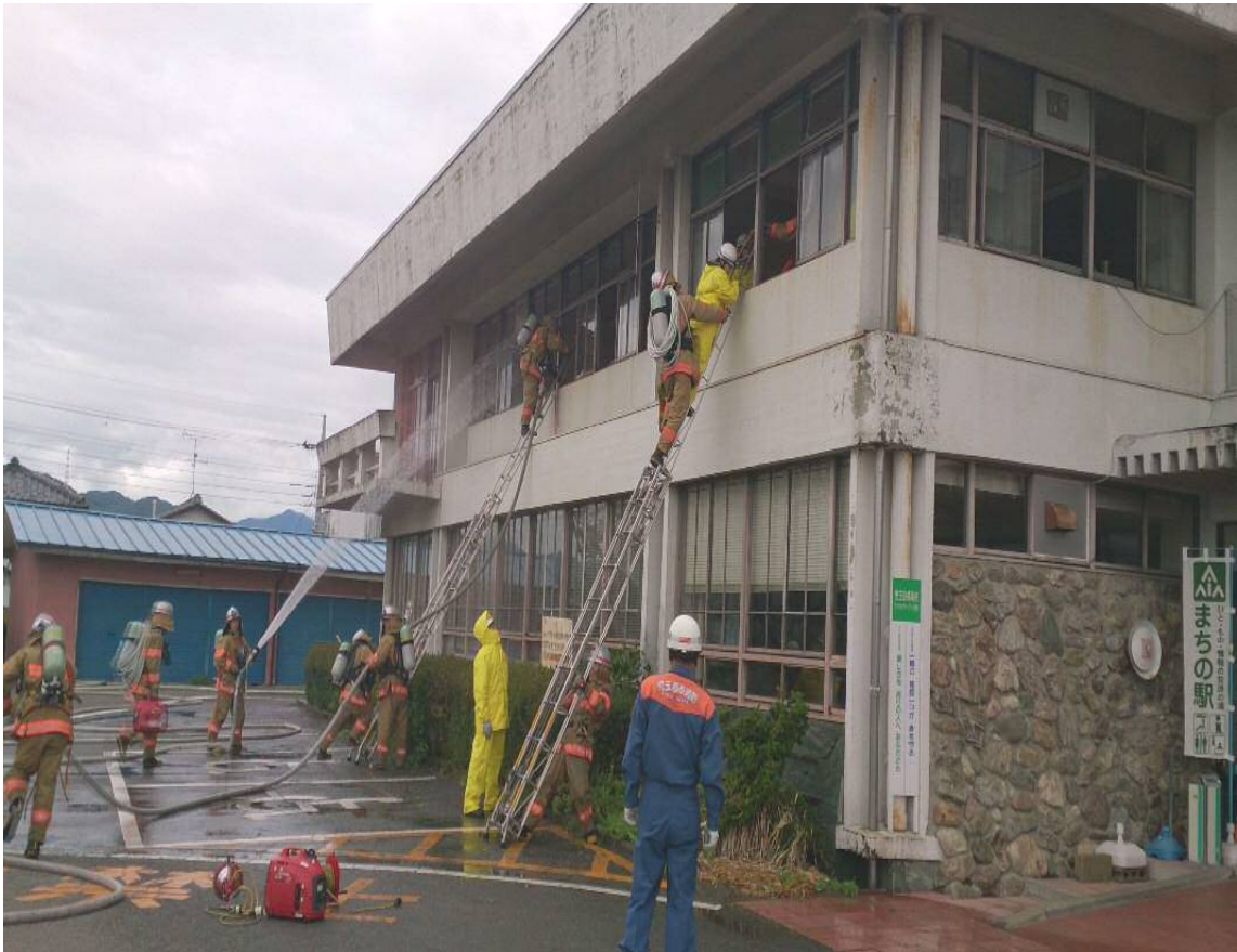
平成 25 年度 消防活動訓練