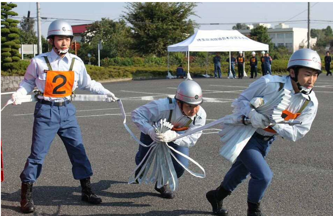
第 26 回自衛消防隊屋内消火栓操法大会