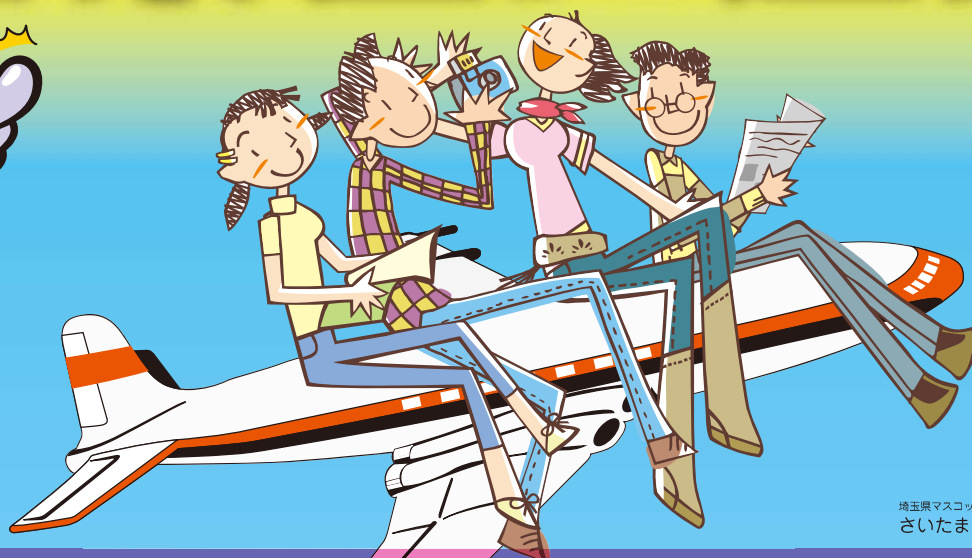
埼玉県マスコット さいたまっち