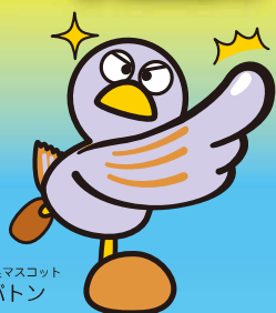
埼玉県マスコット コバトン