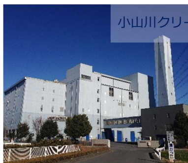
小山川クリーンセンター