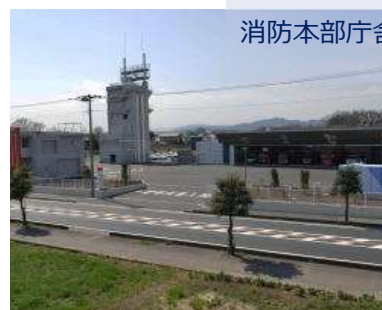
消防本部庁舎及び各分署