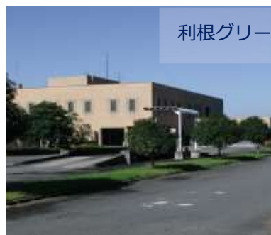
利根グリーンセンター