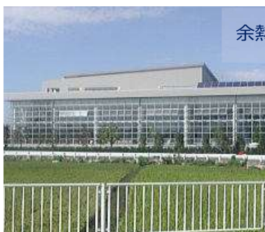
余熱利用施設 湯かっこ