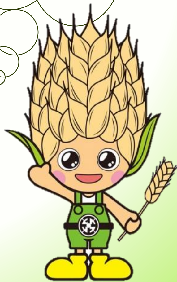
上里町マスコット 「こむぎっち」

問合せ 【美里町】総合政策課 TEL 0495-76-1114 【神川町】総務課 TEL 0495-77-2114 【上里町】総務課 TEL 0495-35-1234 【児玉郡市広域市町村圏組合】総務課 TEL 0495-27-2241