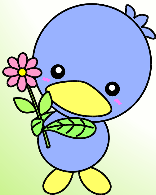
美里町マスコット 「ミムリン」

美里町・神川町・上里町 児玉郡市広域市町村圏組合 皆さまのお越しをお待ちしています。